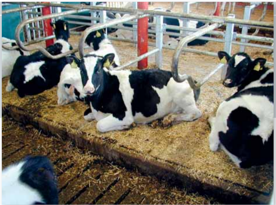
Den omvendte verden.

På samme måde skulle vi også gerne have skabt glade danske landmænd. Lige nu kradses krisen bravt, og prognoser truer med, at