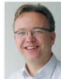
Af Hans Aarestrup, Danske Svineproducenter

redte sand senge, med god plads og et dejligt blødt underlag. Men hvorfor skal den lastrem absolut være lige ud for mit hoved? Det generer udsynet og er i vejen når jeg skal til at rejse mig. Jeg ved da godt at det blev sat op da en af mine venner i sidste uge fik nogle voldsomme trykninger hen af ryggen da hun blev presset under nakkebommen af hende den store 1787 som tror hun skal bestemme det hele, men de kunne nu godt løfte lastremmen bare 25 cm så generer det ikke os og vi opnår det samme. ■