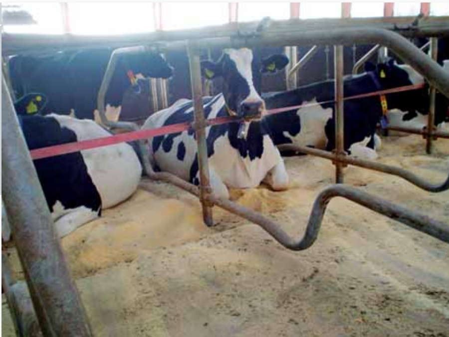
Grænser for frihed.

kommer forbi. Hvorfor snakker jeg egentlig til dig - du fatter jo ikke en skid. Arbejde og sove, det er det eneste, du laver. Hvis du så endda fik penge for det, så gav det jo ligesom lidt mening. Hvis du går nu, hvornår kan du så være væk? Jeg tager tid!